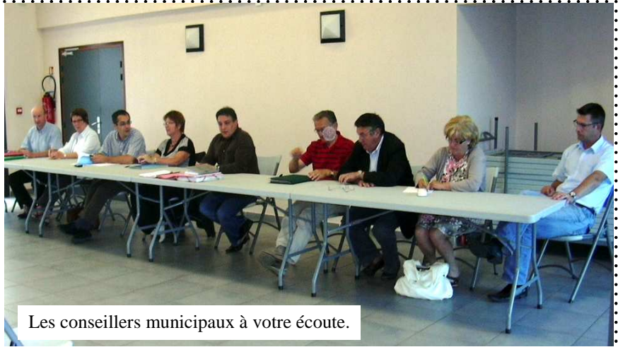
Les conseillers municipaux à votre écoute.

Un bilan général pourra alors vous être présenté.