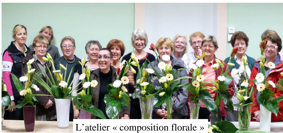
L'atelier « composition florale »

A partir du 1 er avril, quelques modifications au programme rando : chaque 1 er vendredi du mois à la place du jeudi, si le temps le permet, grande rando journée avec pique-nique. Le 1 er avril la beauté du lieu, La Roche d'Hoëtre, a participé à la réussite de cette belle journée. Le dernier samedi du mois pour permettre aux personnes indisponibles